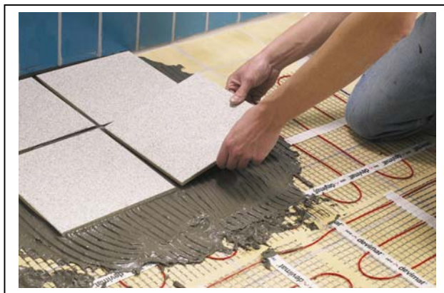
Рис. 3. Монтаж нагревательного мата devimat™ DTIF в ванной комнате на старую плитку.